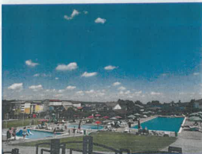
După realizarea lucrărilor de reparații