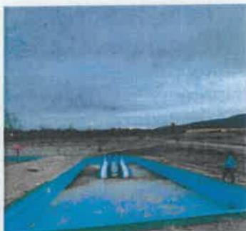
Înainte de intervenție