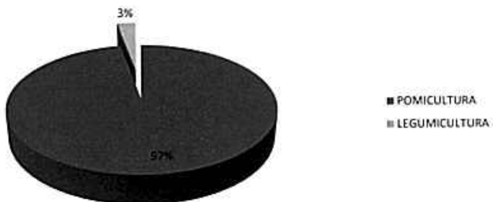
SUPRAFETE CULTIVATE ÎN ULTIMUL AN (HA)