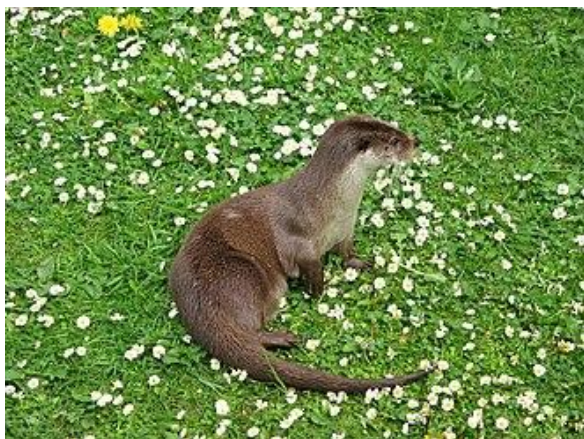
Vidră de râu ( Lutra lutra )

Mamifere: urs brun ( Ursus arctos ), lup cenușiu ( Canis lupus ), mistreț ( Sus scrofa ), căprioară ( Capreolus capreolus ), râs eurasiatic ( Lynx lynx ), vulpe ( Vulpes vulpes crucigera ), vidră de râu ( Lutra lutra ), liliacul comun ( Myotis myotis );