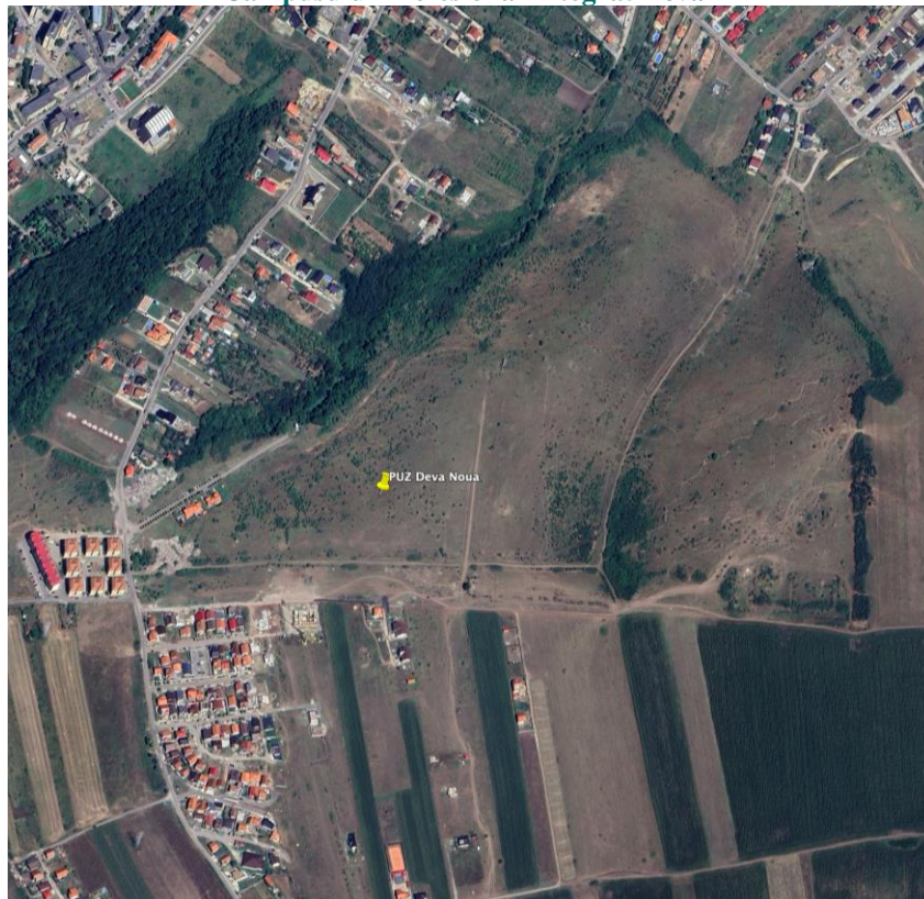
Evoluție zonă - 2022

Terenul are o dimensiune aproximativă de 205977 mp și este identificat prin Carte Funciară: 79116 Deva. Amplasamentul are formă în plan neregulată orientată E-V, cu dimensiunea aproximativă de 393,00 m x 1000,00 m.