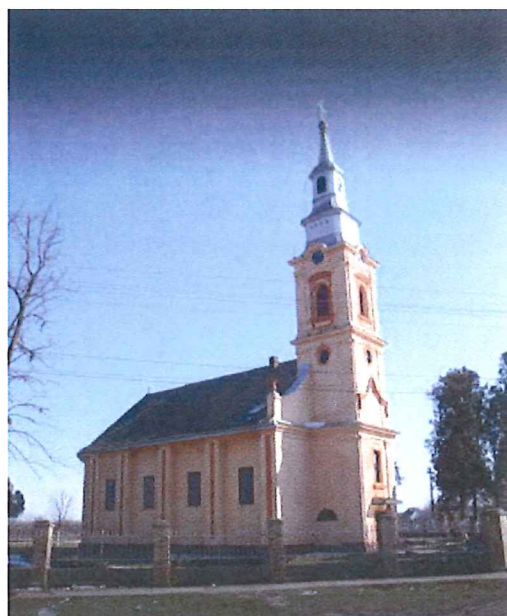
Biserica ortodoxă Sfântul Ilie Tesviteanu

Din hrisovul pictat în pronaosul bisericii aflăm că aceasta a fost târnosită de către episcopul George Popovici al Timișoarei la 19 septembrie 1752 și pictată parțial în tehnica „fresco” de renumitul pictor bănățean Nedelcu Popovici.